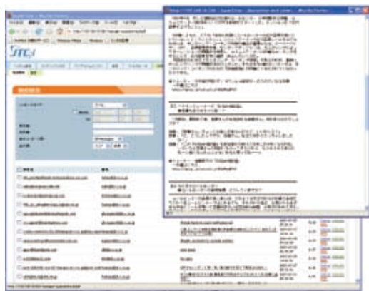
検疫・隔離状況(画面イメージ)